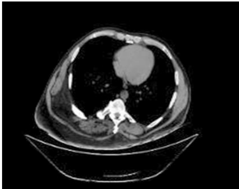
Fig. 1 - TAC de tórax.

músculos subescapular e infraespinoso. Infiltración grasa de los músculos paravertebrales y de la pared lateral del hemitórax derecho con engrosamiento de este último de aproximadamente 33 mm. Llamó la atención lesión lítica a nivel de la unión condrocostal del noveno arco costal posterior derecho que involucró el proceso transverso de T8 de ese lado. Dicha lesión insufla el hueso sin llegar a causar ruptura de su cortical, ni alteraciones de las partes blandas adyacentes en posible relación con condroma (fig. 1).