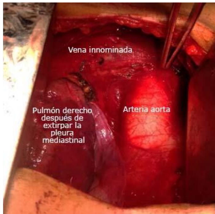
Fig. 1- Campo quirúrgico al finalizar la timectomía transesternal extendida. Fíjese que no hay tejido adiposo. Se identifican el pulmón derecho, la arteria aorta y la vena innominada izquierda con los agrafes para controlar las pequeñas venas tímicas.

La elección del acceso está guiada por la inclinación del equipo quirúrgico hacia la necesidad de extirpar todo el tejido tímico, en conjunto con la grasa mediastinal anterior y superior entre ambos nervios frénicos, desde los ligamentos tirotímicos, en la base del cuello, hasta los ángulos pericardiofrénicos en todos los pacientes con MG (Fig. 1).