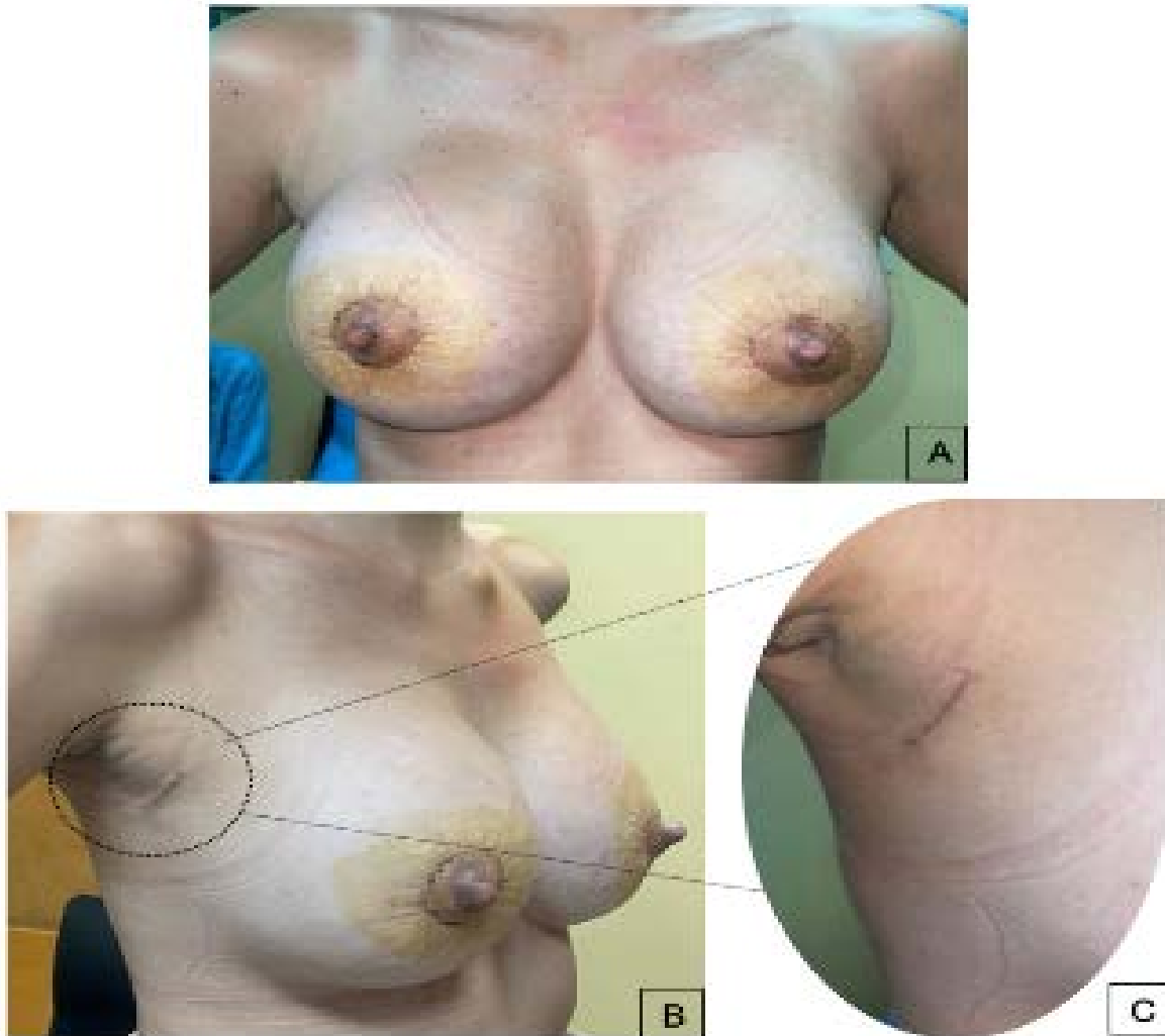
Fig. 2 - Posoperatorio de 30 días tras mastopexia periareolar y recambio protésico con exéresis de siliconoma axilar. A) Vista frontal; B y C) Vista oblicua derecha mostrando recuperación de incisión axilar.