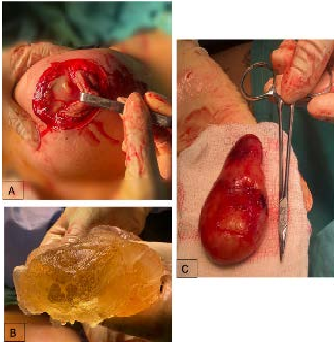
Fig. 1 - Hallazgos intraoperatorios en mama y axila derecha. A) Material amarillento espeso al momento de la capsulotomía derecha; B) Implante derecho con ruptura protésica parcial; y C) tumor axilar derecho de 100 mm x 40 mm.

La evolución posoperatoria fue favorable (fig. 2 A, B y C). Se indicó analgesia, antibiótico por 24 horas, drenajes tipo Jackson-Pratt y sostén compresivo. Fue egresada al segundo día, retirándose drenajes al quinto día. Al día 30 de operada, se evidenció adecuada evolución estética. A los seis meses, la paciente refirió resolución completa de síntomas, con resultado estético y funcional satisfactorio.