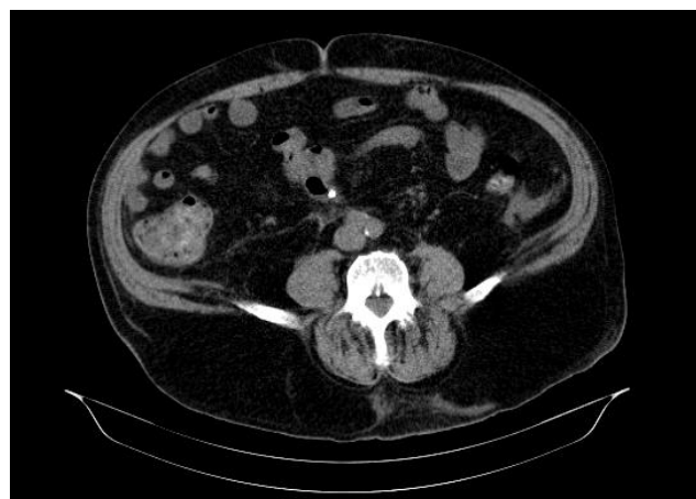
Fig. 2- TC abdomen con prótesis plástica (punto blanco) en pared de sigma.

Se realizó TC abdominal apreciándose neumoperitoneo en hemiabdomen superior, con líquido libre perihepático y en ambas gotieras paracólicas, y neumobilia. La prótesis metálica se encontró correctamente situada en colédoco distal y la prótesis de plástico, de aproximadamente 10 cm de longitud apareció alojada en sigma, perforándolo a ese nivel y atravesando el mesenterio (Fig. 2).