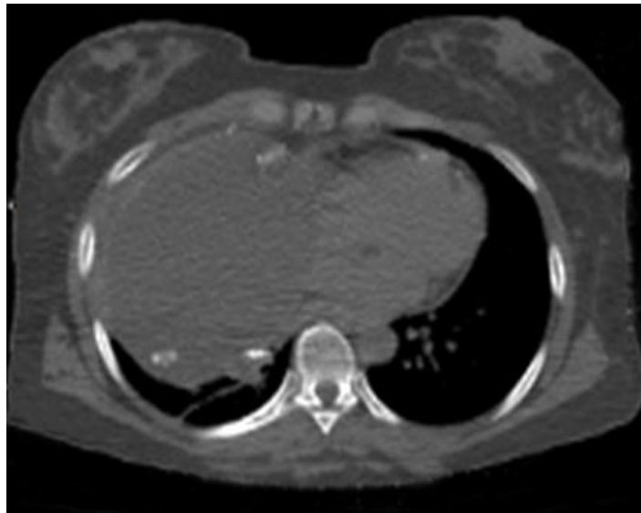
Fig. 1- TAC. Corte axial. Obsérvese la ocupación de la mayor parte del hemitórax derecho por una imagen quística con calcificaciones en su interior, correspondiente a un teratoma benigno.

La radiografía del tórax, en vistas postero-anterior y lateral, es el examen radiológico inicial para tumores mediastinales. La apariencia radiográfica es la de un tumor del mediastino anterior bien circunscrito, redondeado o lobulado, el cual, en dependencia del tamaño, puede desbordar los límites mediastinales hacia los campos pulmonares (Fig. 1).